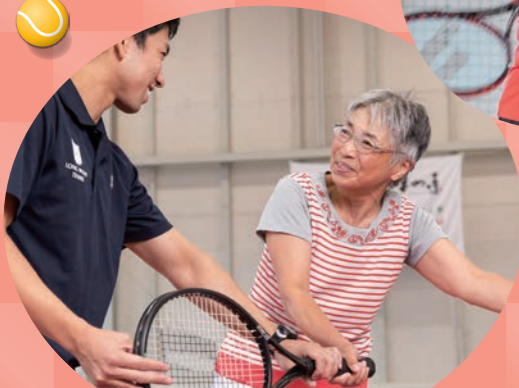
「ほめ達」のコーチ陣の楽しいレッスン!

要予約 お申し込み受付は 1/4(金) 朝8:00~ 気軽にご予約を! 059-381-4440